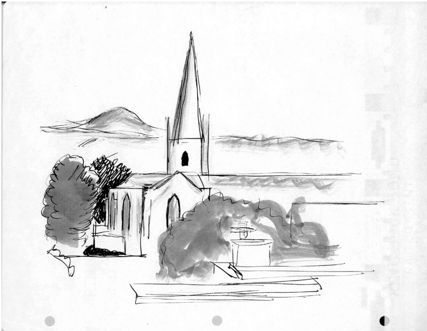
Klasztor Gethsemani, Bradstown, Kentucky, rys. Thomas Merton (0313)

Drawing by Thomas Merton. Used with Permission of the Merton Legacy Trust and the Thomas Merton Center at Bellarmine University.